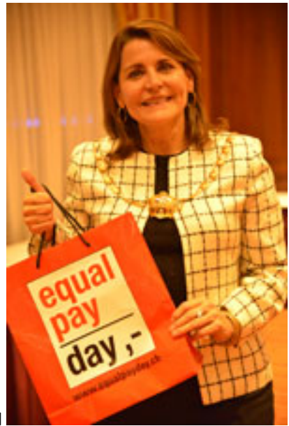
Presidente da BPW INTERNATIONAL = DRA.YASMIN DARWICH